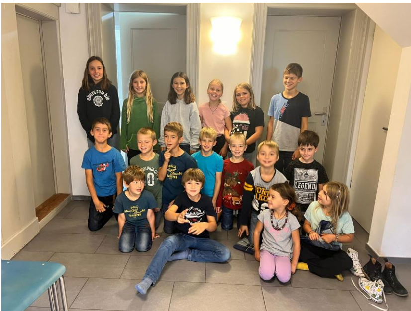
Ein Teil der Kinder

Die Kinder und ihre Leiterinnen freuen sich, Ihnen den Film am 11. Dezember im Rahmen der Kolibri Weihnachtsfeier in der Kirche zu präsentieren.